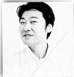
指揮 高橋健介 Kensuke Takahashi